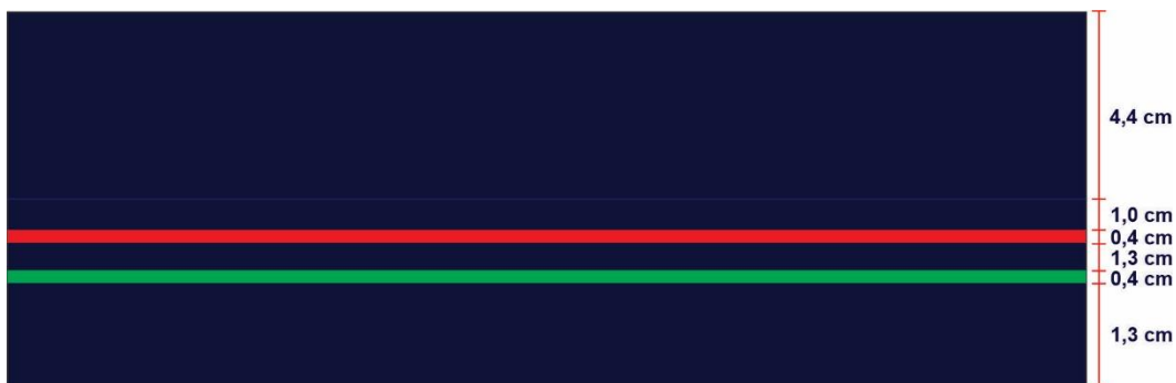
TABELA DE MEDIDAS PARA AS JAQUETAS ESCOLARES