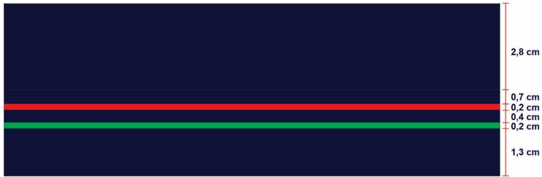
TABELA DE DIMENSÕES DA CAMISETA MANGA LONGA