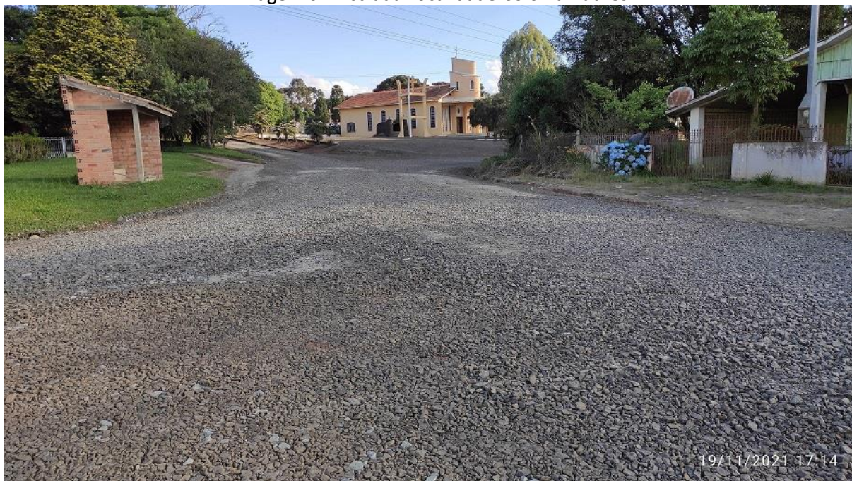
Imagem 02: Estrada Localidade Colônia Ruthes