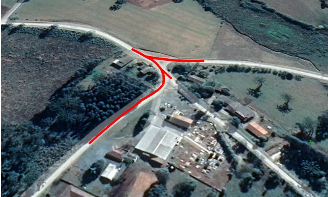
Figura 01: Estradas da Localidade Colônia Ruthes

As presentes especificações têm como objetivo, fornecer informações para a execução de Serviços de PAVIMENTAÇÃO ASFÁLTICA com área total de 2.228,23 m 2 nas estradas da, localidade de Colônia Ruthes, conforme imagens abaixo.