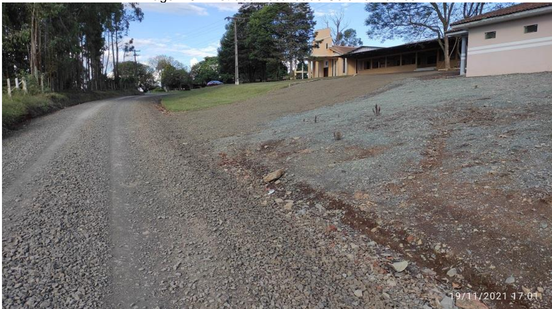
Imagem 01: Estrada Localidade Colônia Ruthes