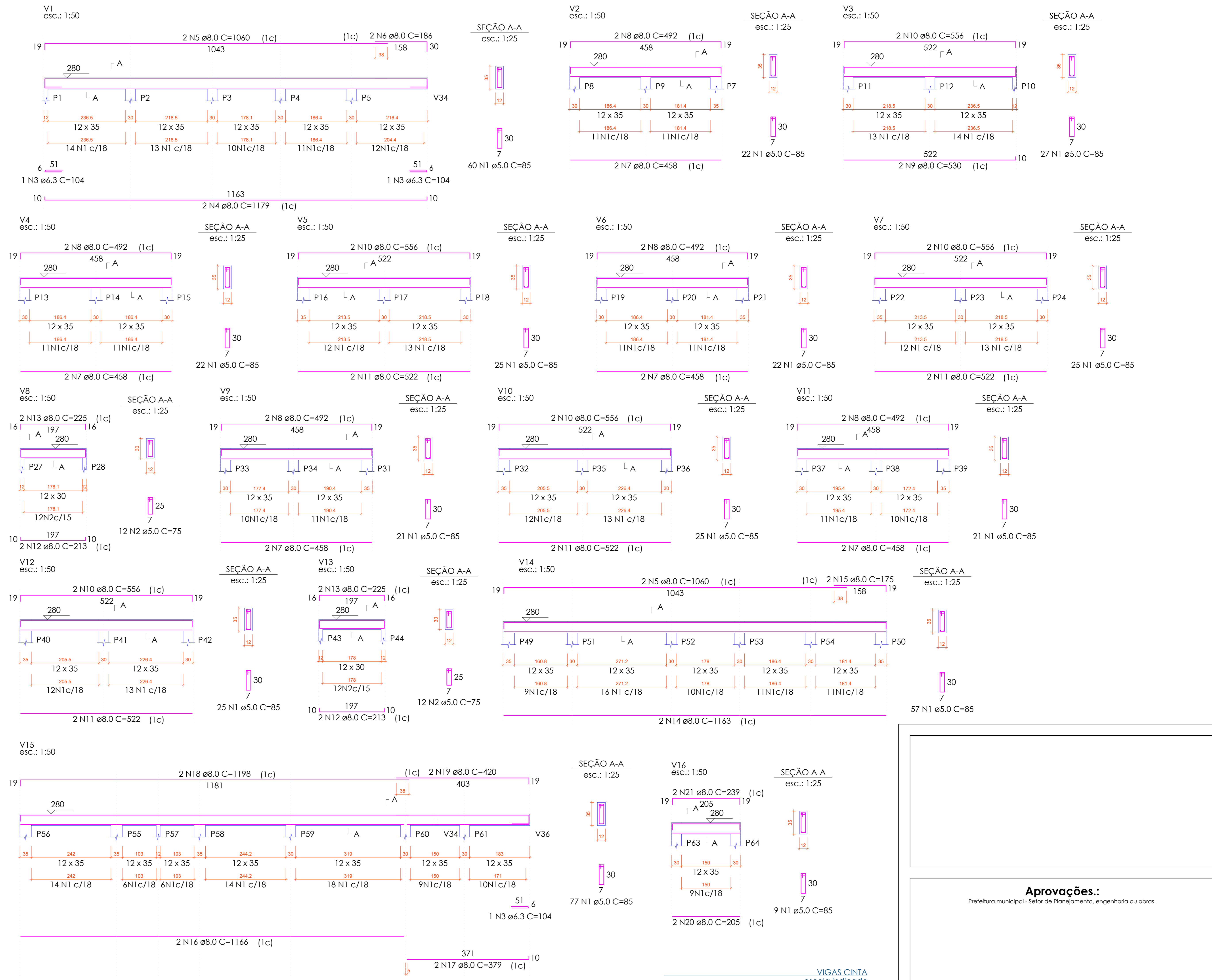
VIGAS CINTA escala indicada