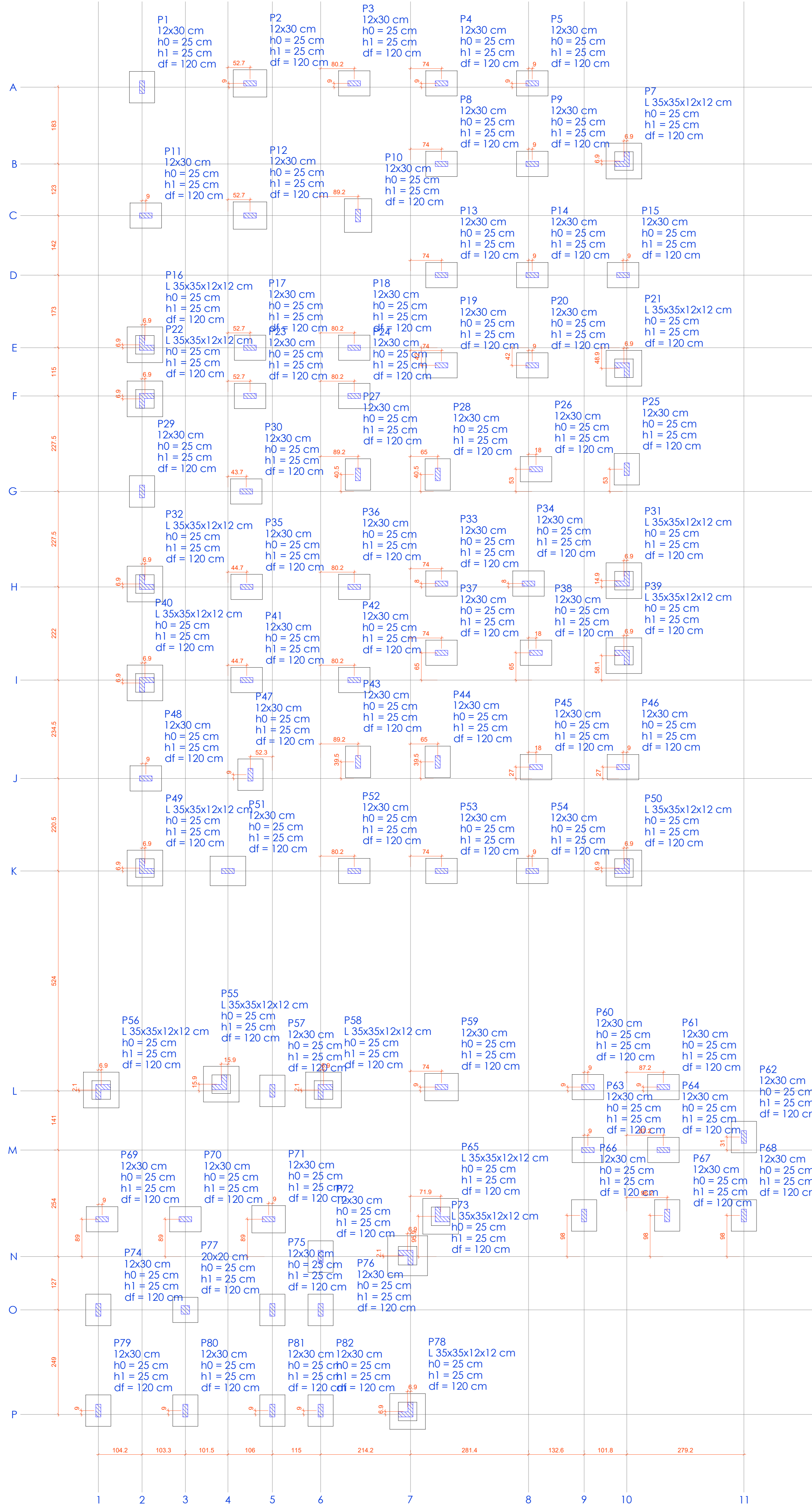
PLANTA DE LOCAÇÃO escala 1:50